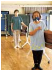
▲高知プリマ会 大人バレー運動で心身ともに 豊かな暮らしへ