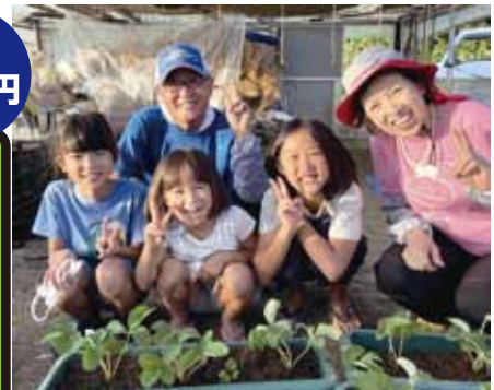
▲FFC 高知 (フーズフォーチルドレン高知) お母さんを笑顔に～子どもの食と環境を整える～