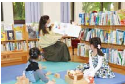
▲高知こどもの図書館 人と地域に寄り添う居心地の良い図書館へ