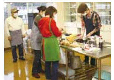
▲ちいきめしプロジェクトinみませ実行員会 食で人と地域をつなぐ(食で地域活性化)