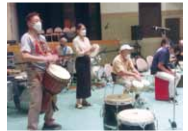
▲パーカッションバンド「エスペランサ」 種崎地区を元気にしたい

提出時に事業内容の確認を行います。事前にご連絡の上、内容説明のできる方がお越し下さい。