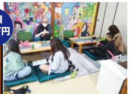
▲もうひとつの大きな家族 世代間交流のできる笑顔あふれる 居場所づくり