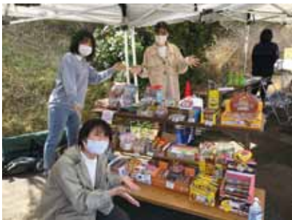
▲だがしやふいーか 大学生が運営する『子どもの居場所』 としての駄菓子屋さん