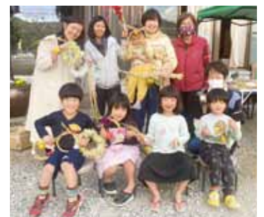
▲FFC高知(フーズフォーチルドレン高知) アート×イートで! 未来子育て環境を整えよう

E-mail info@kochi-machifun.org https://kochi-machifun.org/