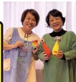
▲こうちあそびマルシェ 子育てサロン「おもちゃの広場」の開催

高知市を住みよいまち、豊かな地域社会にするために行う、 市民の自主的な「まちづくり」活動を応援します。