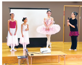
▲高知プリマ会 地域で楽しむ大人バレエ