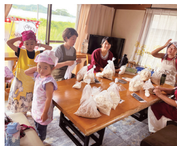
▲FFC高知(フーズフォーチルドレン高知) アート×イトで! 未来子育て環境を整えよう

TEL 088-871-2294(直通) 〒780-8605 高知市南はりまや町1丁目1-1