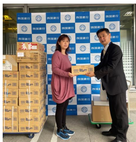
■ NPO 法人こうち食支援ネットへ寄贈