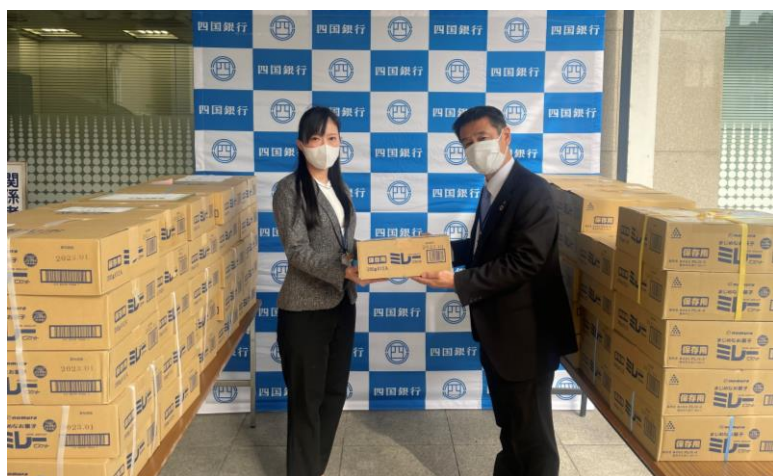
■ 社会福祉法人高知県社会福祉協議会へ寄贈