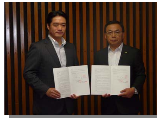
高知県との連携・協力