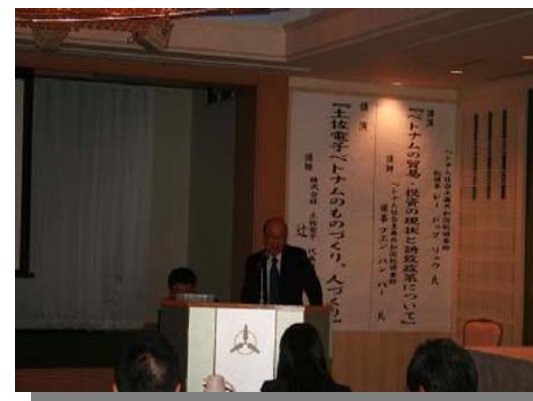
～ベトナム貿易・投資ビジネスセミナー～