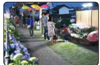
▲はるのあじさいコミュニティクラブ

アートX防災。地域の力を借り、子どもたちを対象に段ボールハウスキャンプを実施。子どもや保護者の防災意識が高まった。