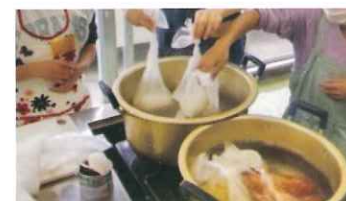
▲こうち減災女子部 あなたもできる防災・減災