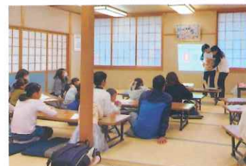
▲いのちのおはなしキャラバン隊！「土佐姉妹」 助産師と一緒に親子で学ぶ性教育講座