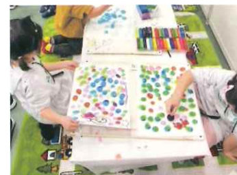
▲FFC 高知 アート×イートで！未来子育て環境を整えよう