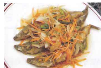
▲ちいきめしプロジェクトin みませ実行委員会 食で人と地域をつなぐ