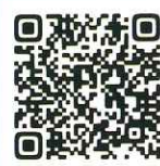
寄付申込フォーム

株式会社 四国銀行 コンサルティング部 信託担当 TEL 088-871-2201（直通） 〒780-8605 高知市南はりまや町1丁目1-1