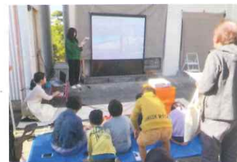
▲yumyum sweets 西畑いにちにカフェ