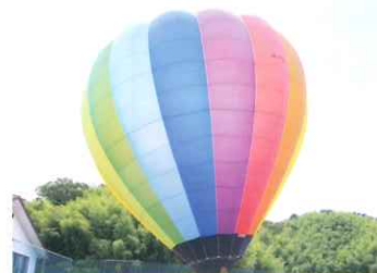
▲はなまるキッズこうち 重度障がい児（者）やご家族の為の スポ・レク活動教室の充実