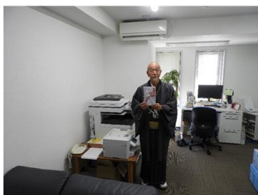
特定非営利活動法人 しばてん大学農学部ひこばえ 様