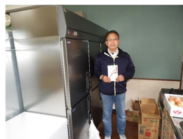
潮江南地域連合会 様