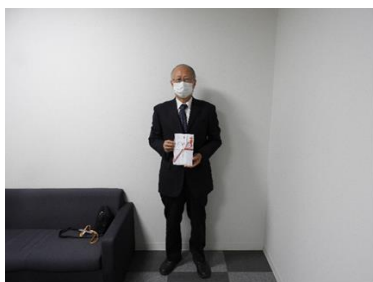
高知県ポッチャ協会 様