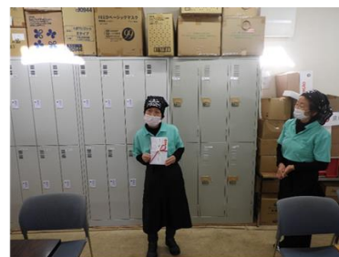
特定非営利活動法人障害者就労支援 B型事業所 四葉のクローバー 様