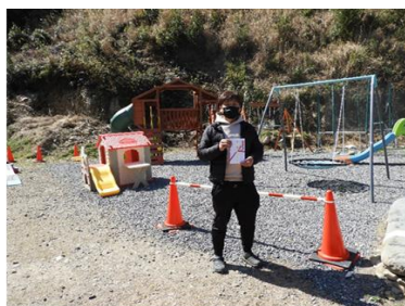
子ども食堂 虹の花 様